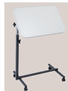
Inclinaison plateau EASY gris perle (421000)