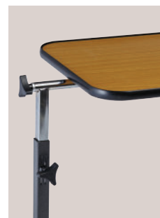
Ajustement latéral (421014)